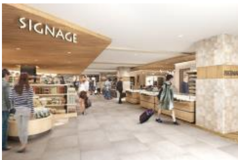
第4期開業エリア 内観イメージ