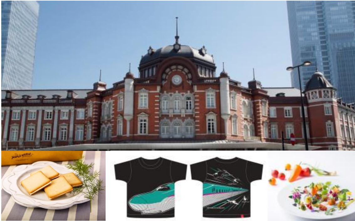
左：東京駅限定人気「お土産スイーツ」売上ランキング1位ザ・メイプルマニア「メイプルバタークッキー 9枚入」(グランスタ) 中央：OJICO「はやぶさTシャツ」(エキュート東京) 右：東京ステーションホテルの夏の女性向け宿泊プラン

沖縄・九州地方から徐々に梅雨明け宣言がされ、いよいよ夏本番が近くなりました。今回のニュースレターでは、帰省の際に手土産としておすすめしたい東京駅グルメ&スイーツ情報、そして東京駅直結の夏休みおでかけスポット情報をご紹介します。