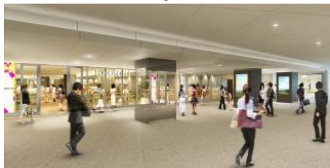
第4期開業エリア 内観イメージ