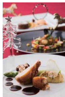
クリスマスランチコースイメージ ※手前は、熊本県産地鶏“天草大王”のロースト“TERIYAKI”赤ワインソース