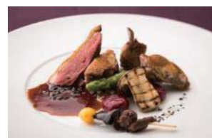
肉料理 フランス トゥーレーヌ産仔鳩のロティ 赤ワインソース