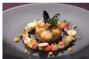
冷前菜 モンサンミッシェル産ムール貝と帆立貝柱のジュレキャビアを添えて“まるごとBon Appetit”

【期間・提供時間】2017年12月15日(金)-12月25日(月)17:00-22:00 【提供メニュー】「TENQOOムニュー ドゥ ノエル」(全11品)18,000円(税サ込)