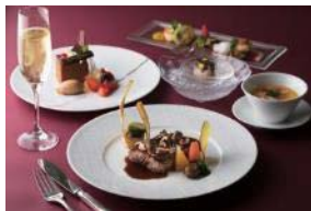
アトリウムのクリスマスディナーコースのイメージ

クリスマスの夜は〈アトリウム〉がライブスペースに大変身。女性のボーカルによる美しいクリスマスソングを聴きながら、スペシャルディナーをお召し上がりいただける特別なクリスマスナイト。3日間限定でお届けします。メインディッシュは黒毛和牛のローストをセップ茸と赤ワインの濃厚ソースで。グラスシャンパーニュも付き、クリスマスムード満点のひとつときをお過ごしいただけます。