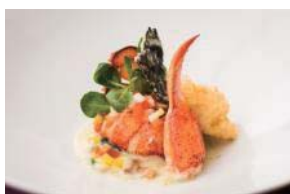
魚料理 オマール海老のポワレ 海苔の香るソースプラン