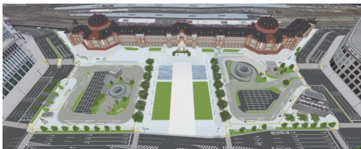
広場整備イメージ

広場内を横切るように大きな部分を占めていた都道を広場外周に再整備(都市計画道路幹線街路補助97・98号線)し、丸の内中央広場の南北に路線バス・タクシー等の交通結節機能を集約。日本のセントラルステーションに相応しく、日本の豊かな四季を彩るサクラやモミジなどの木々が植えられています。