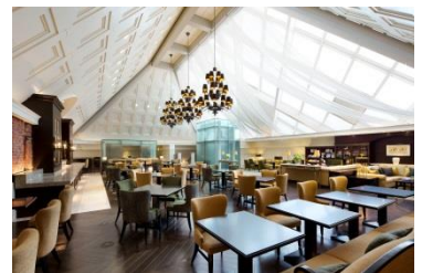
アトリウムの内観