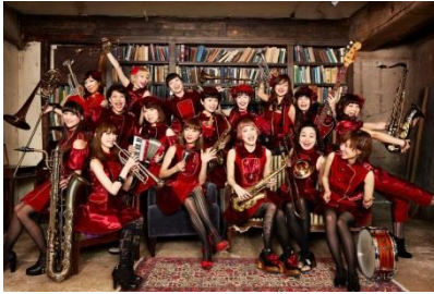
たをやめオルケスタ

お問い合わせ:Tel.03- 5220-1951(バー&カフェ<カメリア>直通)