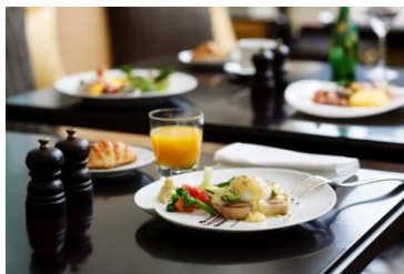
エッグベネディクトのイメージ

通常約 110種類 もの和洋食アイテムを、お好きなだけお召し上がりいただけます。一番の人気は目の前で作る卵料理。ホテル伝統のビーフシチューソースなど、 3種類 から選んだソースを包んだオムレツや、オリジナルスタイルのエッグベネディクトも人気の一皿です。また、たくさんの種類をお召し上がり頂けるよう、あえて小さなポーシェンでご提供する心配りも。デニッシュ&プレートも 10種類 以上あり、オーガニックジュースや豆乳もあつたりと、体に優しいメニューも豊富。素敵な1日の始まりを、東京ステーションホテルの朝食で迎えてみてはいかがでしょうか。