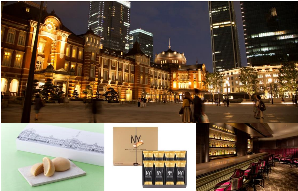
左：“東京駅舎”デザインパッケージ商品 奈良 天平庵「東の京」(エキュート東京) 中央：「東京駅×今年の新作」限定 お土産スイーツ売上ランキング1位 NY PERFECT CHEESE「ニューヨークパーフェクトチーズ 8個入」(南通路) 右：TSH COUNTDOWN PARTY 2017 to 2018 at Camellia(東京ステーションホテル)

2017年も早いものでもう年末。東京ステーションシティ(運営：東京ステーション運営協議会)より、帰省のシーズンに外せない「東京駅限定×今年の新作」お土産スイーツランキングや、東京駅で大人気の「東京駅丸の内駅舎デザイン」のお土産商品を一挙にご紹介！また、12月7日に全面供用を開始した「丸の内駅前広場」でますます注目を集める東京駅を、数字で大解剖。東京駅の広さや歴史などの基本情報から、人気のお土産や駅弁の秘密、日本で一番の売上を誇るコンビニなど、東京駅の知られざるトリビアをご紹介します。