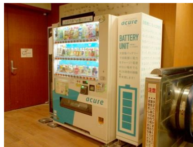
中央線1・2番線ホームのエスカレーター横バッテリー自販機