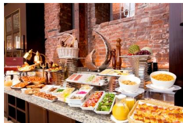
朝食buffetの集合イメージ