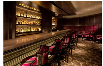
バー&カフェ(カメリア)内観