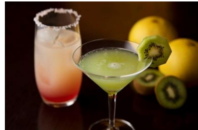
Spring Cocktail イメージ

期間：3月1日(金)～4月30日(火・祝) 時間：11:30～23:30 L.O. 価格：各1,800円(税込サ別) お問い合わせ：03-5220-1951(カメラリア直通)