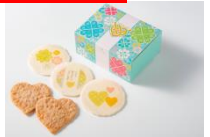
はあとえびせんべい (桂新堂/グランスタ)