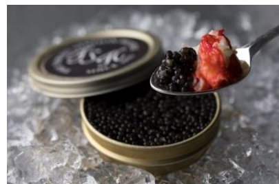
3月16日からのメニュー 「キャビアとたらば蟹シュープリーズ」 イメージ

期間：2019年4月30日(火・祝)まで 時間：17:30～21:00 L.O. 価格：16,800円(税込サ別) * 3月16日より17,800円(税込サ別) * ランチタイム限定のコース(7,800円/税込サ別)もご用意 お問い合わせ：03-5220-0014(プラン ルージュ直通)