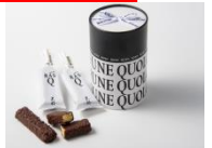
ノボラスキュ (黒船/グランスタ)