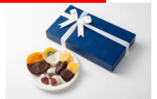
ドライフルーツチョコレート (プログレ/グランスタ)