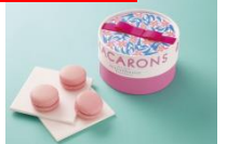
マカロンブレース (資生堂パーラー/エキュート東京)