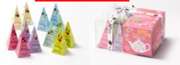
ORGANIC TOKYO TEA (ビーブルバイコスメキッチン /グランスタ丸の内)