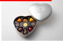
ホワイトデーセクション (ビエール マルコリーニ/グランスタ)