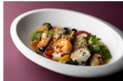
アクアパッツァ イメージ

期間：3月1日(金)～4月14日(日) 時間：11:00～L.O. 価格：3,480円(サラダ、紅茶orコーヒー付/税込サ別) * スパゲティニーはセットで2,680円(税込サ別) お問い合わせ：03-5220-1260(ロビーラウンジ直通)