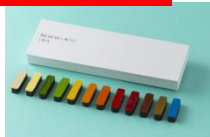
ボンボン ショコラ12P (パティスリー・サダハル・アオキ・パリ / イベントスペース:旬 シュン)