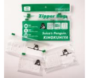
Suicaのペンギン ジッパーバッグ (紀ノ国屋アトレ グランスタ丸の内店 /グランスタ丸の内)