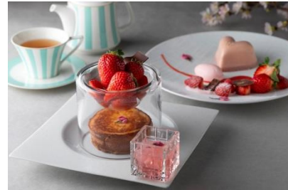
SAKURAスイーツ イメージ

期間：4月1日(月)～4月30日(火・祝) 時間：11:00～L.O. 価格：「SAKURAフレンチトースト」2,980円 「SAKURAムース」2,400円(いずれも紅茶orコーヒー付/税込サ別) お問い合わせ：03-5220-1260(ロビーラウンジ直通)