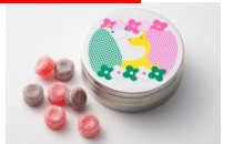
幸せの小さな缶 ショコラ&ベリー (ヒトツブ カンロ/グランスタ)