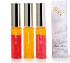
ハニーラスター (ハニーロア/グランスタ丸の内)