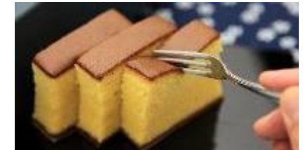
紀ノ国屋アントレ グランスタ丸の内店 (グランスタ丸の内) / 3切れ 516円

徳島の和三盆糖、長崎の太陽卵、佐賀のもち米水飴など、使用原料はすべて天然自然素材を使用。素材にこだわり、ひとつひとつ丁寧に焼き上げられた「かすてら」です。