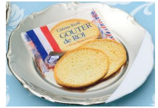
ガトーフェスタハラダ (グランスタ東京) / 2枚×13袋入 972円

ガトーフェスタハラダは明治34年に創業しました。看板商品のガトラスク「グーテ・デ・ロワ」のサクサクとした食感と芳醇なバターの香りは多くのお客さまよりご好評いただいております。