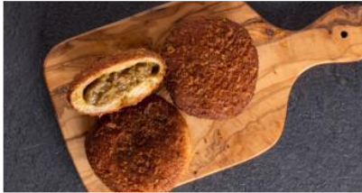
Zopf カレーパン専門店 (グランスタ東京) / 1個 324円

千葉県松戸市の駅から遠く離れた閑静な住宅地の中にひっそり佇みながら、「パン好きの聖地」と呼ばれ多くの人を集める「Zopf (ツォッフ)」。1日に700個ほど売れ、Zopfで不動の一番人気を誇るオリジナルカレーパンを、東京駅にて揚げたてで提供します。パンファン垂涎の専門店です。 ※カレーパン専門店は東京駅限定