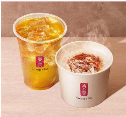
▲彩々粥 ティーセット

果実感溢れるフルーツピューレに果実酒を合わせ、甘酒※、小豆等を隠し味に加え、深い味わいのホットとするスムージーに仕上げました。 ※アルコール成分は入っておりません。