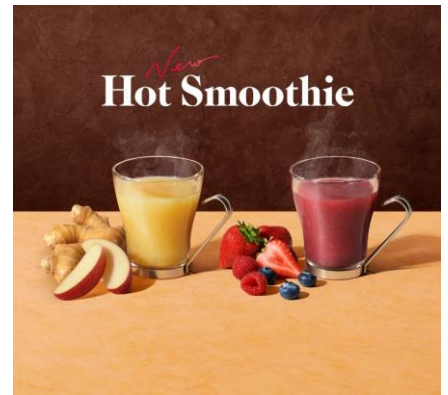
▲ホットスムージー