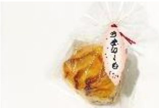
日本百貨店とうきょう (グランスタ東京) / 248円

鳴門金時(サツマイモ)の自然のうま味をそのまま生かしたスイートポテト菓子「うまい〜も」。ふんわりとしたやわらかい生地とその親しみやすいユニークな愛称が地元で大好評のお菓子です。