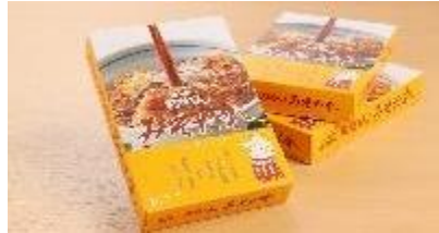
名古屋名物 みそかつ矢場とん (グランスタ東京) / 4袋入 600円

1947年創業。名古屋市中区に本店を構えるみそかつ専門店。旨味の決め手・秘伝のみそだれは門外不出のレシピで、一年半熟成させて天然醸造の豆味噌を使用。毎日職人の手により、創業当時の味を守り続けています。