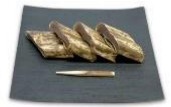
菓匠禄兵衛 (エキウト東京) / 324円

1926年滋賀県で創業した近江銘菓。滋賀の素材、伝統、地域性にこだわり創業以来守り続ける、菓匠禄兵衛伝統のでっち羊羹。昔懐かしい素朴な味わいともっちりとした食感がウゼになる竹皮に包んだ蒸し羊羹です。