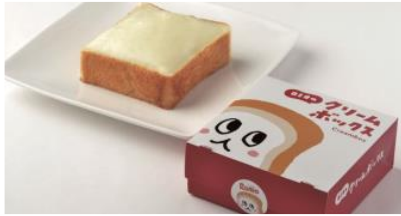
もの (グランスタ丸の内) / 280円

ミルク風味の食パンに濃厚で後味あっさりなミルククリームをのせた福島県郡山市のご当地グルメです。昭和51年、ベーカリーロミオで誕生して以来、長年みなさまに愛され続けています。木曜日と土曜日限定の13:30~販売で、お日持ちは製造当日なので、作りたてを新幹線で運んでいる東京駅店だからこそお取り扱いできる商品です。