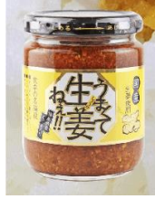
ニコリーナ (エキウト東京) / 648円

福島・猪苗代町の吾妻食品がつくる国産生姜を特製醤油に付け込んだ万能調味料です。ご飯のおともに、おかずの調味料にも使えます。