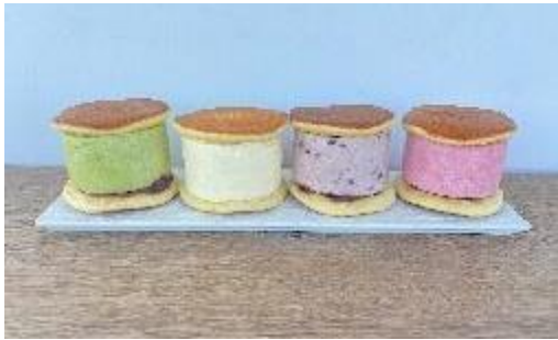
▲左からあん生どら焼 抹茶小豆クリーム、チーズクリーム、つぶあんクリーム、いちごクリーム

自家製の粒あんをたっぷり入れたあんこ好きのためのあんこプリンです。エキュート京葉ストリート限定で登場予定です。