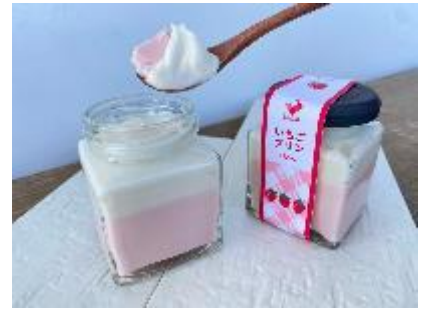
▲エキュート京葉ストリート限定「いちごプリン白あん」