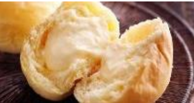
八天堂 (エキウト京葉ストリート) / 230円

昭和8年に広島みはら港町に創業。八天堂の代名詞でもある「くりむパン カスタード」は、あっさりシンプルなカスタードクリームに最高級の純生クリームを合わせたプレーンな「くりむパン」です。