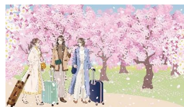
本フェア特別書き下ろしイラスト例

東京都在住のイラストレーター。 挿絵や、広告イラスト、イベントビジュアル、百貨店コラボ企画など幅広く活躍。 水彩イラストで描いた、オリジナル雑貨ブランド「mirafuru」を手掛ける。 著書に『花kotoba 美しい花と女の子 寄り添う花言葉画集』、『FASHION GIRLS』(KADOKAWA出版) Instagramフォロワー：5.4万人（2023年3月現在）