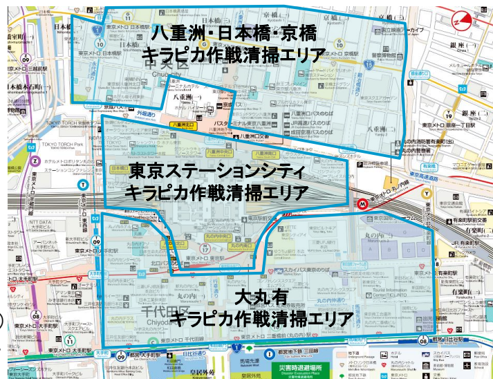
「東京エキマチ キラピカ作戦」清掃エリア全体

事務局: 東京建物(株)、中央日本土地建物(株)、八重洲二丁目北地区エリアマネジメント