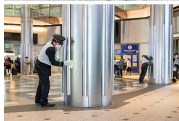
↑ 前回「第15回東京エキマチ キラピカ作戦」実施の様子