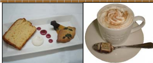
左:スイートチリの手作りシフォンケーキとパクチーのクッキー、右:キャラメルチャイラテ

また、お店で手作りのオリジナル「スイートチリの手作りシフォンケーキとパクチーのクッキー」も楽しめます(販売:3月7日~14日、価格:750円)。