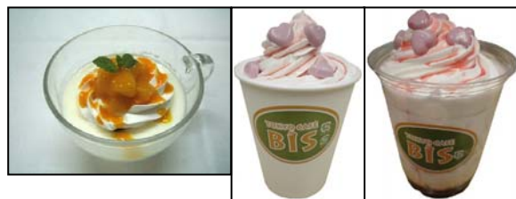
左:手作り杏仁豆腐 マンゴーソース、中:ストロベリーショコラホット、右:同アイス

「改札を出ずに待ち合わせ」にピッタリの「カフェビス」では、春らしいいっぱいドリンク「ストロベリーショコラ」を販売。HOT、ICE が選べます(販売:2月1日~3月14日、価格:550円)。お店で手作りの春らしいスイーツ「手作り杏仁豆腐 マンゴーソース」も登場(販売:2009年3月7日~14日、価格:500円)。