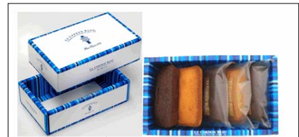
フィナンシェアソート

「ル・コルドンブルー」からホワイトデーオリジナル商品の、プレーン、チョコレートフィナンシェの詰め合わせ「フィナンシェアソート」が登場。