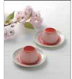
春のさくらんぼプリン

■ ヨックモック さくらクッキー <取り扱い店舗:銘品館中央通路店・東京南口店>