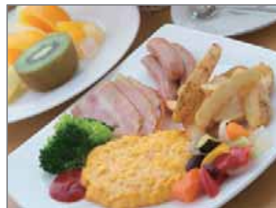
朝食ビュッフェイメージ