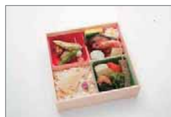
吹き寄せ弁当～春小町～

・桜海老三色真丈…桜と萌える大地をイメージし、春ならではの色合いに仕上げました。