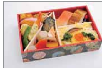
日本のおもてなし弁当

・紅鮭押し寿司 ・穴子押し寿司 ・ちらし寿司(漬蓮根、海老甘酢漬、椎茸煮、菜の花お浸し、いくら)・煮物(里芋、筍、蓮根、南瓜、人参、蒟蒻、茄子揚浸し) ・松前漬 ・江戸巻 ・蒲鉾 ・帆立風味フライ ・海老しそ衣揚 ・しし唐素揚