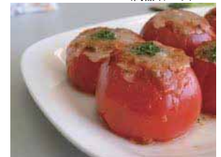
大地を守る Deli(商品イメージ)

有機野菜宅配のパイオニア「大地を守る会」が手がける、無添加のお惣菜や大地のおいしさたっぷりの野菜を東京ステーションシティで手軽にご購入いただけます。