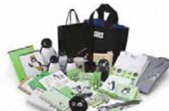
(右)文具から衣料まで多彩に展開

雑誌「オレンジページ」とのコラボ商品ははじめ、通常はエキナカで販売していない商品なども多数取り揃えます。