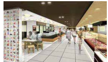
フードライブゾーン(イメージ)