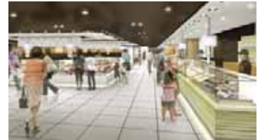
スイーツゾーン(イメージ)

3月28日(日)、東京駅改札内1階の新商業ゾーン「SouthCourt(サウスコート)」(旧Dila東京メディアコート)に「エキュート」がオープンします(運営:株JR東日本ステーションリテイリング)。今回デビューする新ブランド10ショップや東京初出店6ショップなど合計31ショップがオープン、さらに3か所のイベントスペースを設けて期間限定で各地の商品を販売します。「ニッポン Re-STANDARD」をストアコンセプトに、「ennichi(縁日)」のような場を展開、「ニッポンの技術が活かされたモノ・コト」が東京駅に集積します。エキュート内各ゾーンのショップ例を以下にご紹介します。