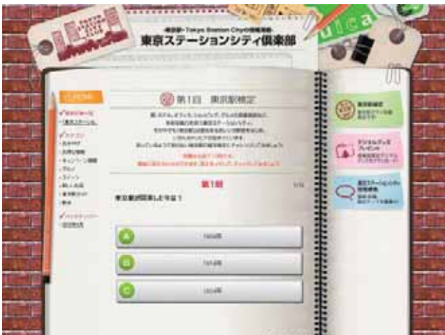
東京駅検定認定ブログパーツ

2014年で開催100周年を迎える東京駅。1914年(大正3年)の開業以来、震災に耐えた建築様式や、日本初の鉄道駅併設ホテルなど、数多くの歴史を刻んできました。このような東京駅の魅力を発見していただこうと、史上初の「東京駅検定」をコンテンツとしてご用意しました。級に合わせて切符型の認定証(ブログパーツ)を発行します。