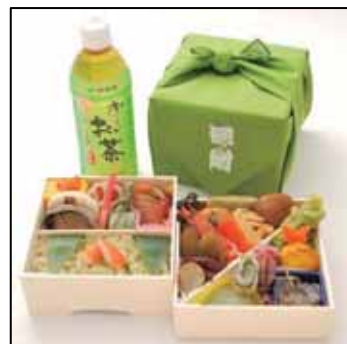
「極附弁当」伊藤園版イメージ

今回発売の「極附弁当」は、お茶をテーマにした特別版です。株式会社伊藤園の「お〜いお茶」と抹茶でふっくら炊き上げたご飯や緑茶粉末とその成分「カテキン」と「さつまいも」が入った飼料で育てられた「茶美豚(チャーミートン)」の唐揚げ、白舞茸を抹茶入りの衣で揚げた舞茸抹茶衣揚、抹茶生ゆばなど「お茶」にこだわり抜いた逸品です。※「お〜いお茶 500mlPET」付き