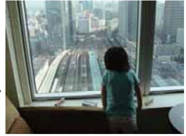
部屋から東京駅を一望(イメージ)