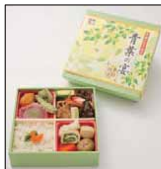
「季節の吹き寄せ弁当～青葉の宴～」イメージ

柚子風味のタレにじっくりと漬け込み、一切れずつ丁寧に焼き上げたイナダ 柚庵焼や、契約栽培農家による有機認証米秋田県産あきたこまちを使用した風味豊かな鯛炊き込みご飯、こりこりとした食感が楽しい山海月(やまくらげ)醤油煮、季節の煮物など丁寧に仕込んだ食材を彩り豊かに盛り込みました。