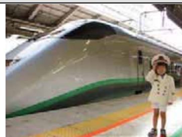
新幹線前で記念写真(イメージ)

部屋は、本州の新幹線を見渡せる希少なお部屋をご用意。また大好評の子ども用駅長服を着て新幹線を背景に撮影が出来る特典など、鉄道好きな「子テツ」の夏休みの思い出に最適なプランです。