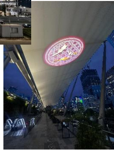
ライトアップイメージ