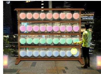
提灯スタンド(グランルーフガーデン会場のみ)