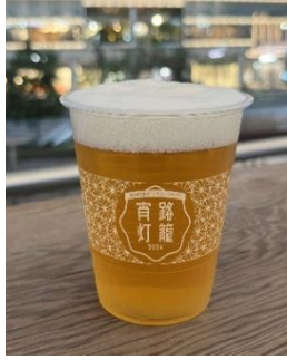
オリジナルカップ

※営業時間はショップにより異なります。 ※オリジナルカップは数量限定となりますので、なくなり次第、通常カップでのご提供となります。 ※数に限りがございますので、品切れの際はご容赦ください。