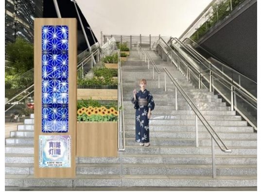
階段に設置する灯籠型デジタルサイネージ