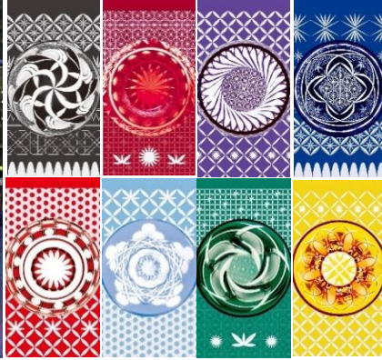
8色の江戸切子紋様