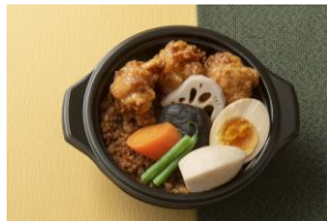
串くらの鶏からあげ丼/ 串くら 京都・御池（エキュート東京） 1,000円（税込）

京都の老舗焼き鳥屋が手掛けるからあげ丼。ジューシーな鶏もも肉の唐揚げと甘辛く煮た鶏そぼろ、味の染みたまごや野菜がのった新定番の丼ぶり。