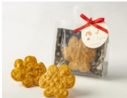
にやらんせんべい/ 富士見堂（グランスタ東京）

1個480円（税込） 北海道十勝産の低糖あんバターをパンケーキでサンド。ほっこり“にやらん”がプリントされボリューム満点。