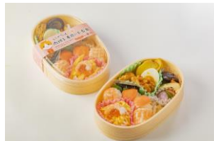
にやらん肉球お寿司のお弁当/ 笹八（グランスタ東京）

2袋入432円（税込） 職人の技が光るキュートな肉球型。梅おほかか味です。 ※期間中限定150セット