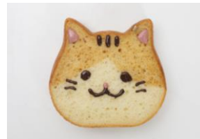
ねこねこ食パン にやらん/ 東京ねこねこ（エキュート京葉ストリート）

1食1,080円（税込） ちらし寿司と手まり寿司で肉球に。春を感じるお弁当です。 ※1日限定5食