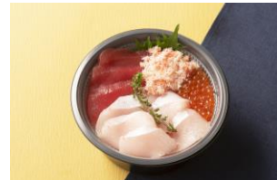
ぶりの海鮮4色丼/ 魚力海鮮寿司（エキュート京葉ストリート） 1,280円（税込）

今が旬の根菜など、栄養価に優れた8種の緑黄色野菜に、ビタミンB1豊富な豚の生姜焼きを合わせた「身体にうれしい」が詰まったヘルシーな丼ぶりです。