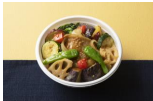
ポークジンジャーと8種のベジタブル丼/ V PALETTE（エキュート東京） 880円（税込）

京都の老舗焼き鳥屋が手掛けるからあげ丼。ジューシーな鶏もも肉の唐揚げと甘辛く煮た鶏そぼろ、味の染みたまごや野菜がのった新定番の丼ぶり。