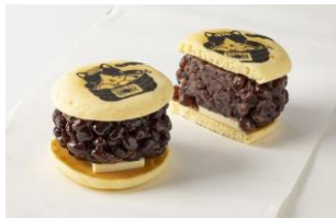
東京にやらん あんパンケーキ/ 東京あんぱん豆一豆（エキュート東京）

◆出店場所：フェア参加店舗はこちらからご確認ください（ https://www.jalan.net/news/article/523354 ）※2月9日より公開予定 <おすすめ商品>