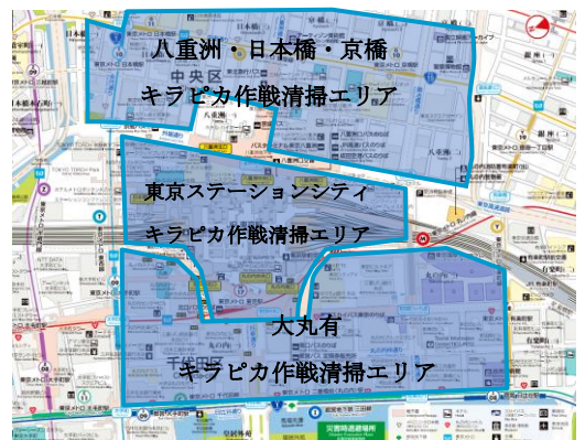
「東京エキマチ キラピカ作戦」清掃エリア全体