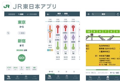
シンプルでわかりやすい乗換案内 各路線のホーム上の情報