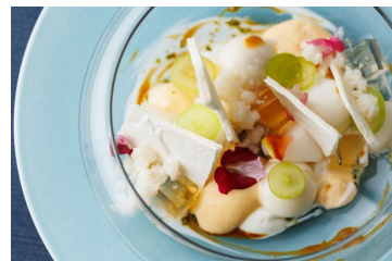
■第2弾：「ラ・フランスのパルフェ」 10月24日（火）～11月30日（木）