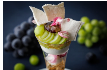
■第1弾：「シャインマスカットのパフェ」 9月20日（水）～10月20日（金）

※アルコールが含まれています。未成年、妊娠中、授乳期の方、車の運転をなさる方はご注文をお控えください。