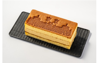
東京生カステラサンドー東京駅ー 1個 1,800円