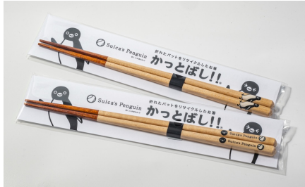
Suicaのペンギン かつとばし！！

Suicaのペンギンは東日本旅客鉄道株式会社の「Suica」のキャラクターです。 ※JR東日本商品化許諾済です。