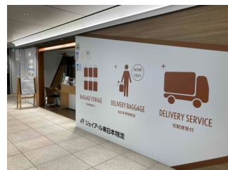
BAGGAGE STORAGE + (手荷物一時預かり所)

予約ができる、外出先でのベビーカーレンタルサービスで東京駅では改札内外あわせて5箇所、貸出場所があります。事前にWEBサイトからご希望の場所でベビーカーが予約でき、貸出を行った場所以外にも持ち出し可能です。1時間から、最大7日間ご利用いただける、お子様とお出かけをもっと手軽にするサービスです。