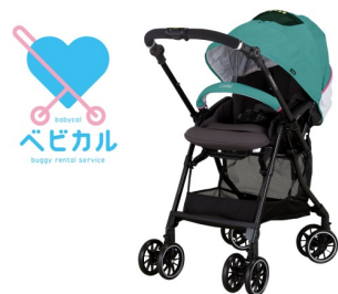
東北新幹線E5系はやぶさモデルの ベビーカー