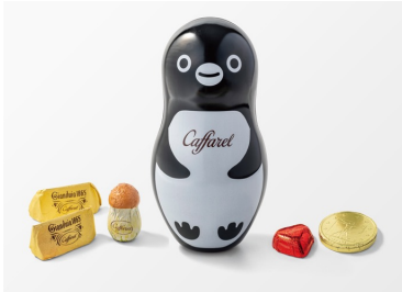
Suicaのペンギン ピンコロ缶 (チョコレート5粒) / 1,296円

東京駅のエキナカ商業施設「エキュート東京」「グランスタ東京」と改札外「グランスタ丸の内」にて、10月2日（月）から10月31日（火）までの期間、「Suicaのペンギンと鉄道フェア 2023」を開催いたします。期間中は、Suicaのペンギンをモチーフにしたスイーツやグッズのほか、東京駅丸の内駅舎 & 鉄道グッズなどをバリエーション豊かに取り揃え、エキュート東京、グランスタ限定商品や、新商品、フェア期間限定商品など、多数登場いたします。