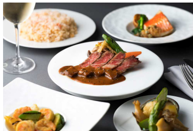
※お皿に盛りつけた状態