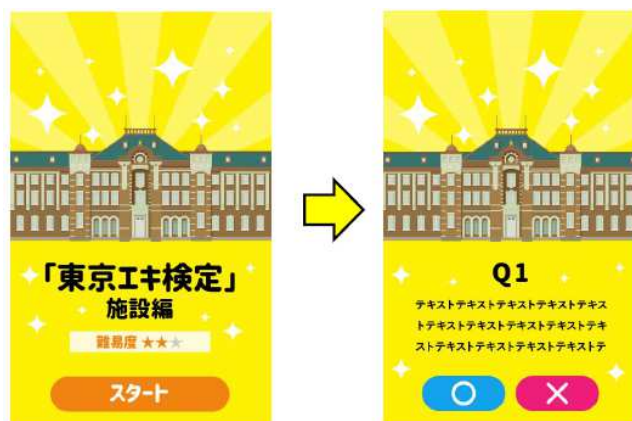
【特設サイトイメージ】